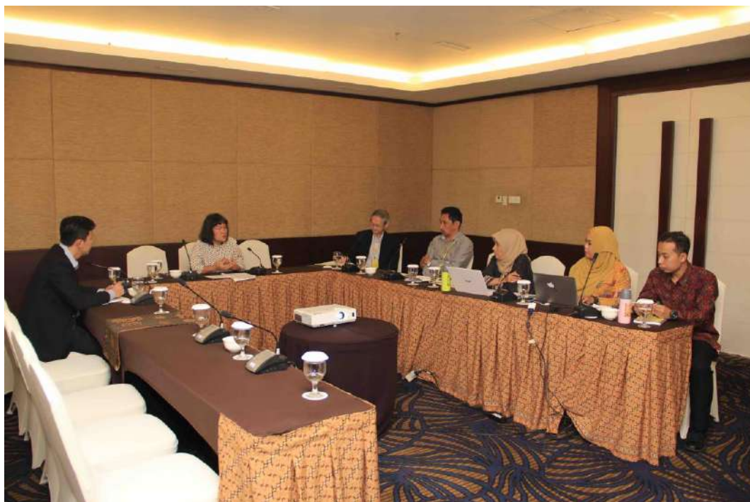
Miembros de uno de los cuatro grupos de trabajo debaten un tema el primer día de la reunión.

Cuatro grupos de trabajo se reúnen el martes para debatir cuatro temas clave: los DENP; el mercado y la trazabilidad; la identificación de productos de especies arbóreas; y el fomento de capacidad y la gobernanza. La presidencia de cada grupo de trabajo informa de los resultados de sus debates en la reunión plenaria del jueves por la mañana.