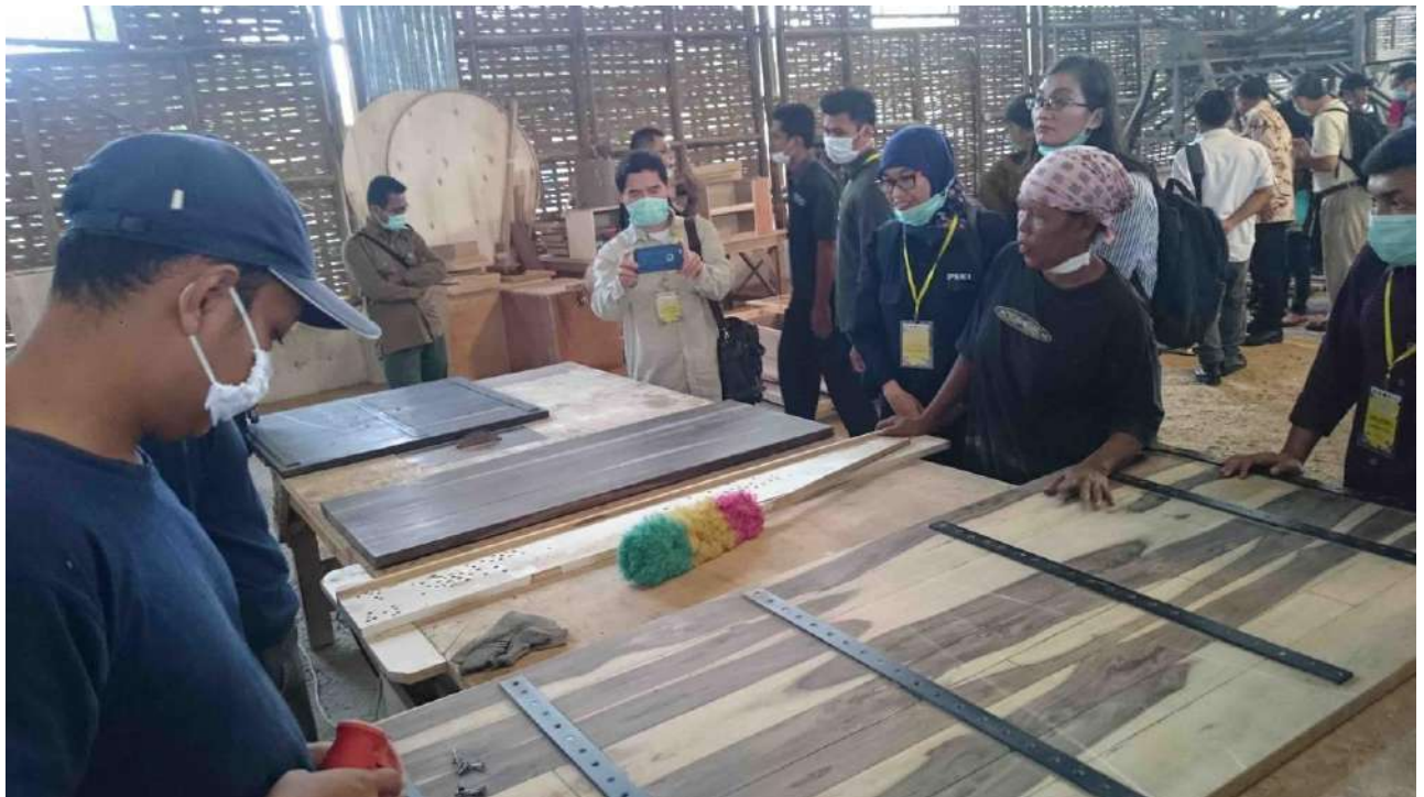
Los participantes en la reunión visitan un establecimiento de procesamiento de madera de Dalbergia cultivada en plantaciones cerca de Yogyakarta, Indonesia.

Yogyakarta, Indonesia 25 a 29 de junio de 2018