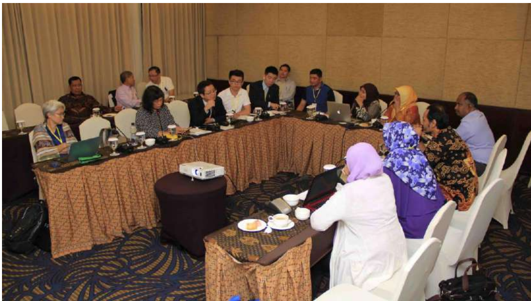
Los miembros de uno de los cuatro grupos de trabajo discuten un tema durante el taller.

Dos grupos de trabajo se reúnen el jueves por la tarde y el viernes por la mañana y debaten sobre los DENP para madera de agar de bosques naturales y plantaciones, respectivamente. La Presidencia de cada grupo de trabajo informa de los resultados de los debates en la reunión plenaria del viernes por la tarde. También se brinda a los participantes la oportunidad de formular observaciones sobre una versión de las recomendaciones, y éstas se incorporan a continuación en la medida de lo posible.