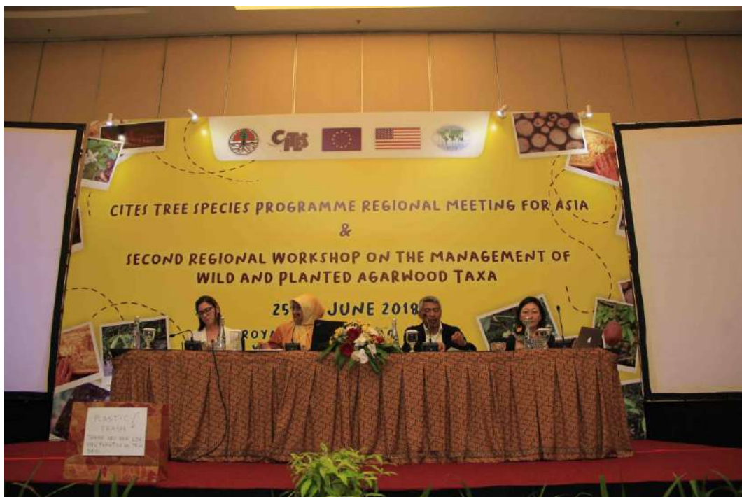
Oradores de la Sesión 1 y Presidente (segundo a partir de la izquierda) del Segundo taller regional asiático sobre la gestión de los taxones que producen madera de agar silvestres y plantados.